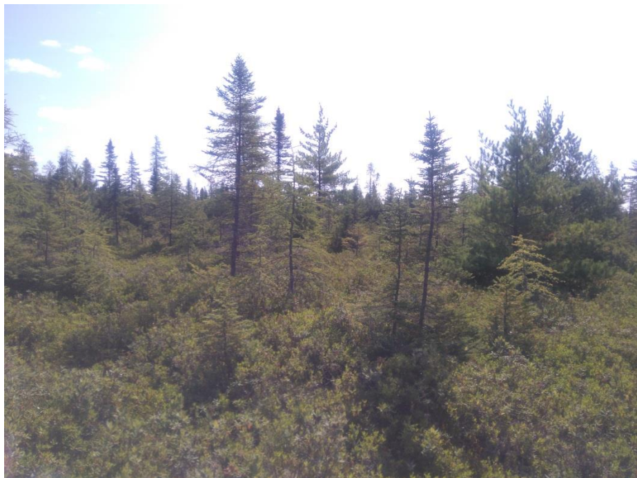
Figure 2 : Transition entre le lagg et le bog arbustif, partie sud. Présence de plusieurs gros arbres.