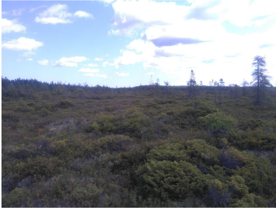
Figure 1 : Bog à sphaigne, partie sud.