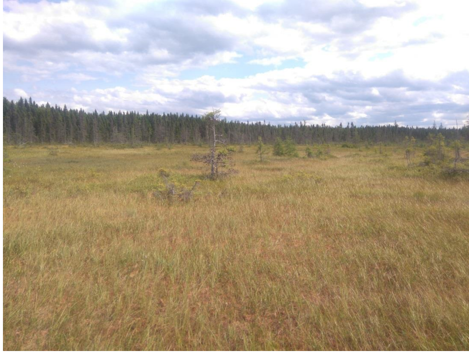
Figure 3 : Fen, partie sud. Présence de plusieurs herbacées.