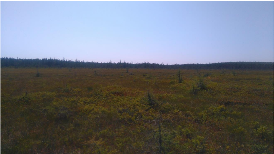
Figure 6 : Bog/fen, partie nord. Avant plan: îlots de bog formés sur le fen Arrière-plan: fen uni