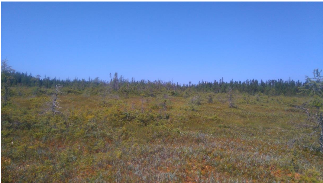
Figure 4 : Bog à sphaigne, partie nord.