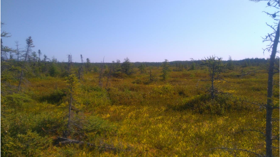
Figure 5 : Bog arbustif, partie nord.