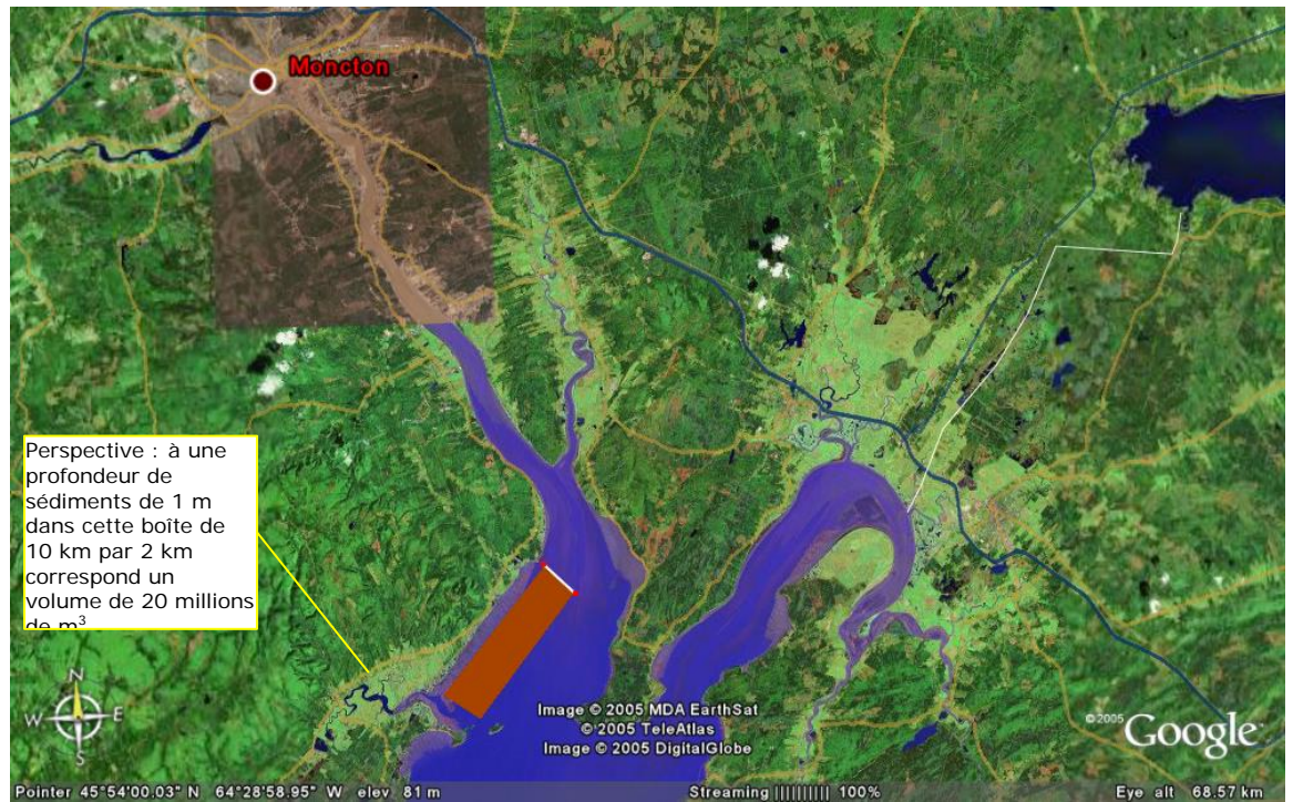
Figure 1 Vue annotée de la baie de Chignecto et de la rivière Petitcodiac