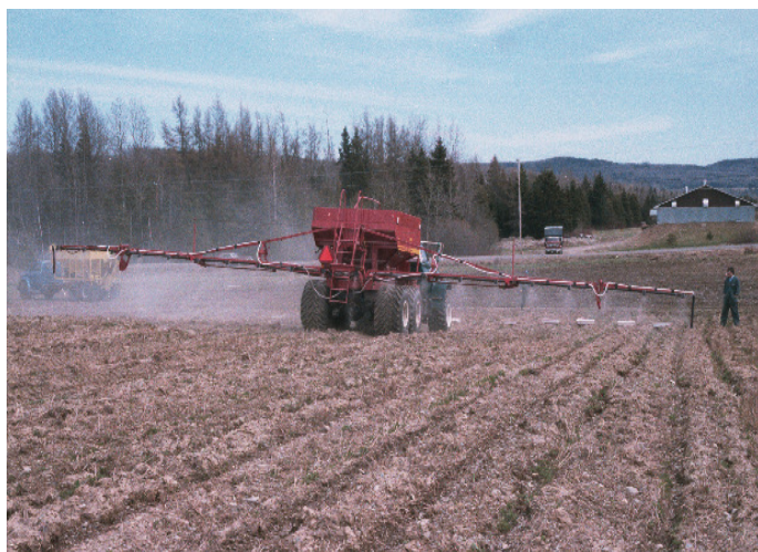
Figure 3. Fonctionnement de l'épandeur d'engrais pneumatique avec bacs collecteurs d'engrais

Avec les épandeurs à la volée, un recouvrement des passages est nécessaire pour distribuer uniformément l'engrais dans le champ entier. Souvent, l'opérateur suit le tracé du passage précédent pour obtenir des largeurs de