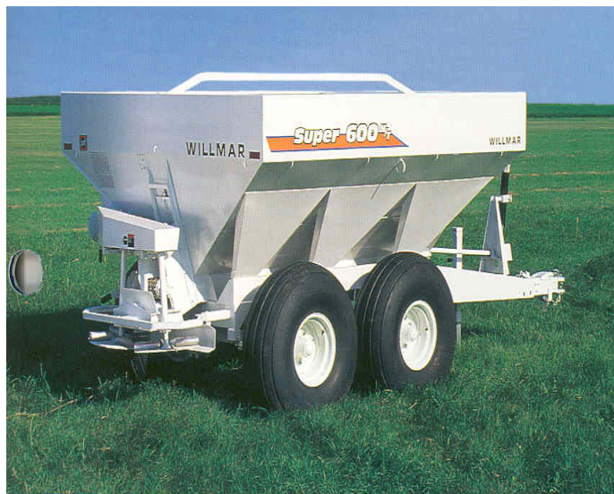
Figure 2. Épandeur à la volée (à double disque tournant)

Les facteurs qui entrent ensuite en ligne de compte pour un épandage régulier concernent les composantes de l'épandeur, qui exigent inspection, entretien et d'être mises au point. Si on utilise un épandeur à disque tournant traîné, semblable à celui montré à la figure 2, il est nécessaire de régler la hauteur du distributeur d'engrais par rapport à la surface du sol, d'effectuer la mise à niveau de