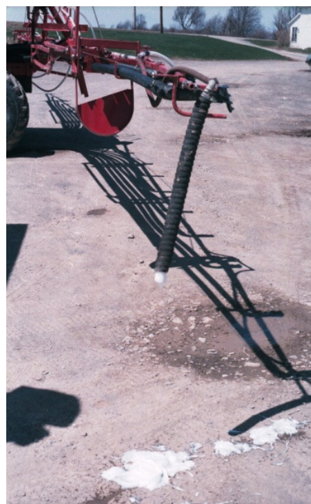
Figure 5. Système de marquage à mousse

La méthode par tâtonnement et approximations successives pour régler le débit de l'épandeur n'est pas idéale. Les formules proposées pour chaque type d'épandeur à la dernière page (= feuille de calcul) de cette fiche technique permettront d'accélérer le processus de réglage. On recommande de vérifier le taux d'application réel qui fournira une référence pour le réglage du taux d'application voulu. Les formules sont organisées de manière à calculer le taux d'application réel de l'équipement. La deuxième série de formules calcule la quantité d'engrais qu'il faut recueillir pour en arriver au taux d'épandage voulu.