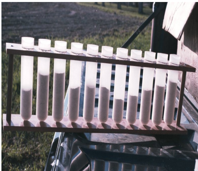
Figure 4. Schéma d'épandage démontré avec l'aide d'éprouvettes

travail parallèles dans tout le champ. On peut se servir de bacs spéciaux disposés dans le champ pour vérifier le débit des épandeurs à la volée et des épandeurs pneumatiques, comme le montre la figure 3. L'engrais recueilli dans chaque bac est placé dans des éprouvettes pour évaluer le schéma d'épandage. Les éprouvettes illustrées à la figure 4 montrent une répartition inégale de l'engrais. Cela est dû à une mauvaise mise à niveau des rampes ou à une mauvaise distribution de l'engrais par le mécanisme doseur primaire, là où l'engrais est acheminé vers les tubes pneumatiques.