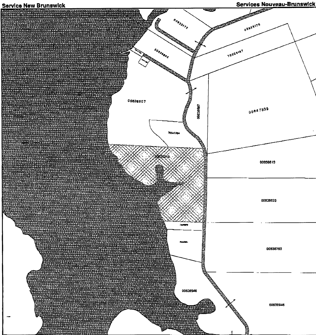
Map Scale / Échelle cartographique 1 : 11255

While this map may not be free from error or omission, care has been taken to ensure the best possible quality. This map is a graphical representation of property boundaries which approximates the size, configuration and location of properties. It is not a survey and is not intended to be used for legal descriptions or to calculate exact dimensions or area.